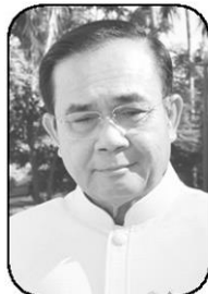
พล.อ.ประยุทธ์ จันทร์โอชา